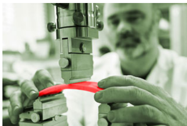
Driepuntsbuigproef: mechanisch onderzoek van E-modulus en buigspanning

Maar liefst 93% van de proefstukken uit kousrenovaties voldoet volledig aan alle vereiste materiaaleigenschappen. Echter: zeven procent behaalt minstens één testcriterium niet. Er blijft dus een klein risico bestaan, aangezien iedere veertiende kous niet voldoet aan de eisen en specificaties.