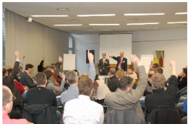
De leden van een netwerk