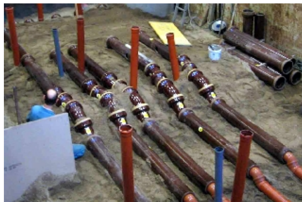
Opbouw van een leidingnetwerk in de grote proefopstelling van IKT.

Een bijzondere specialiteit van IKT zijn de productvergelijkingen , waarin producten en methoden onder laboratorium- en praktijkomstandigheden tot op de bodem worden