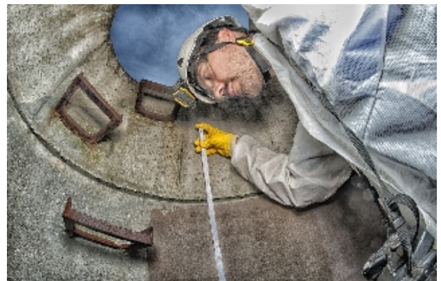
Onderzoek bij putrenovatie

Keuze van renovatiemethode, kwaliteitsborging van renovatiemaatregelen, registratie en beoordeling van de kwaliteit van de renovatie, analyse en toetsing van renovatieschade, praktijkgerichte geschiktheidsproeven van renovatiesystemen.