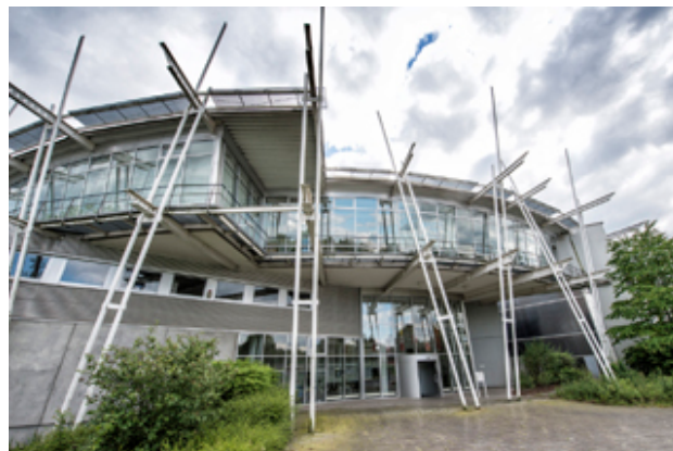
Het gebouw van IKT in Gelsenkirchen (Duitsland).

IKT - Institut für Unterirdische Infrastruktur