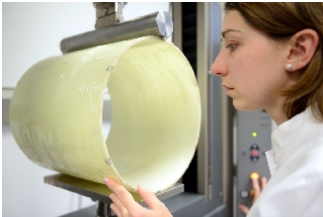
Initiële ringstijfheidsproef van liner-proefstuk

De drie keuringsafdelingen van IKT voeren bijzondere keuringen voor fabrikanten van producten uit: