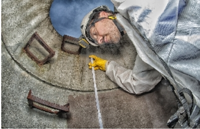
Onderzoek bij putrenovatie

Keuze van renovatiemethode, kwaliteitsborging van renovatiemaatregelen, registratie en beoordeling van de kwaliteit van de renovatie, analyse en toetsing van renovatieschade, praktijkgerichte geschiktheidsproeven van renovatiesystemen.