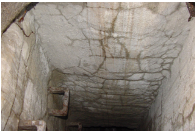
Schade aan een gerenoveerde rioolput

Betonnen en gemetselde putten laten regelmatig de onderstaande schadebeelden zien: