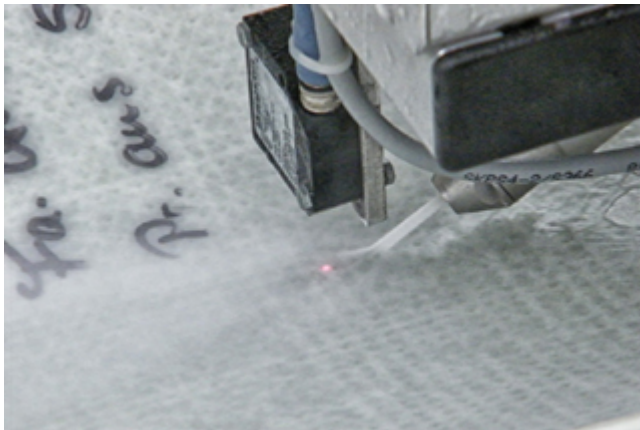
Bestendigheid tegen hogedrukstralen en hogedrukspoeling (DIN 19523) – materiaaltest