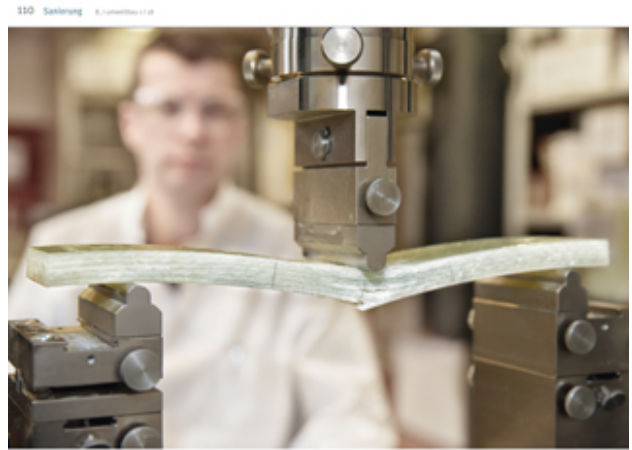
Voor Proef: De IKT-Prüfer umfasst die Begrenzung beim Bau der Linerprobe.